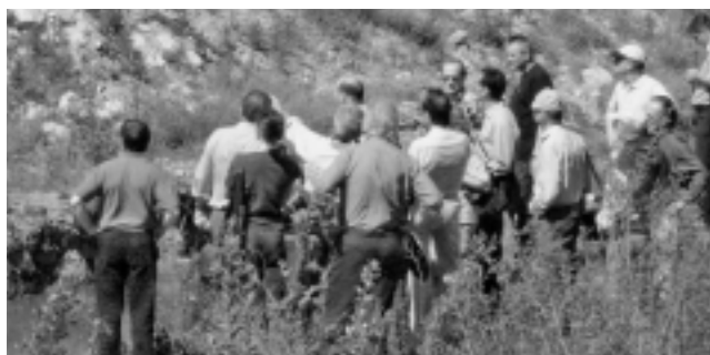
Die Ausbildungsformen müssen den zukünftigen Herausforderungen angepasst werden.

Der Vorstand ist sich bewusst, wie wichtig diese Aufgabe ist. Deshalb versuchen wir überall dort, wo wir Einsitz in Kommissionen und Arbeitsgruppen haben, einen wesentlichen Beitrag zur Erarbeitung einer gezielten Ausbildung zu leisten.