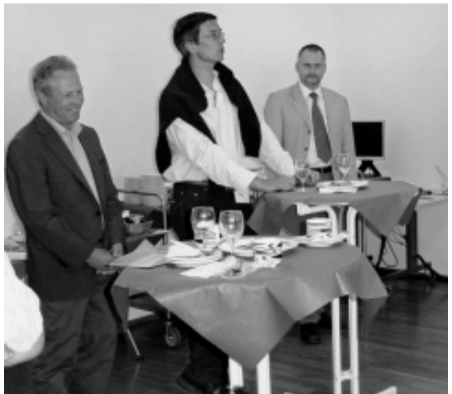
La communication, une tâche importante pour l'association.

Lorsqu'une personne s'investit dans une tâche de présidence, il le fait avec ses visions propres et celles de son comité, mais aussi avec son réseau de contacts. Nous risquons pourtant, si tout se passe bien, de penser que notre façon de voir est la seule qui est juste. Une société doit certes avoir une stabilité, grâce à ses structures et son organisation, mais un-e président-e doit faire évoluer en permanence son association. Le ou la nouvelle élue devra donc, sur des bases saines, insuffler son empreinte sans compromis. N'y a-t-il vraiment personne pour relever le défi? Dans tous les cas, l'article 4.3 de nos statuts est clair, le mandat du président est limité à 8 ans. C'est bien ainsi, il faut de l'air frais et une nouvelle stimulation afin de faire évoluer la dynamique de l'association.