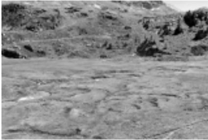
Hohe Natur- und Landschaftsqualität, eine grundsätzliche Bedingung für einen Park (Vallon de Réchy, Wallis).

Die Änderung des Natur- und Heimatschutzgesetzes und die dazugehörige Pärkeverordnung sind auf den 1. Dezember 2007 in Kraft getreten. Die Schweiz verfügt somit über eine neue gesetzliche Grundlage, welche die geltenden Normen für neue Nationalpärke, regionale Naturpärke und Naturerlebnispärke festlegt.