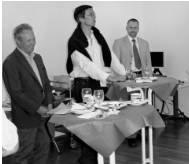
Die Kommunikation – eine wichtige Aufgabe des Verbandes.

unserer Statuten klar: das Präsidentenamt ist auf acht Jahre beschränkt. Das ist auch richtig, denn es braucht frischen Wind, neue Impulse, um die Dynamik unseres Verbandes zu erneuern.